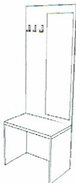
Widok poglądowy – wieszak z lustrem i bagażnikiem

Lustro o grubości 4 mm naklejone na element wykonany z płyty meblowej melaminowanej o grubości 18 mm. Wielkość lustra w stosunku do wielkości płyty powinno być taka aby dawała margines 5-10 cm na obwodzie w stosunku do wielkości płyty. Lustro należy przymocować do ściany w sposób niewidoczny w miejscu wskazanym przez zamawiającego. Błat i nogi bagażnika winny być z płyty pogrubionej do min 36 mm. Trzy wieszaki zamontowane na płycie garderoby.