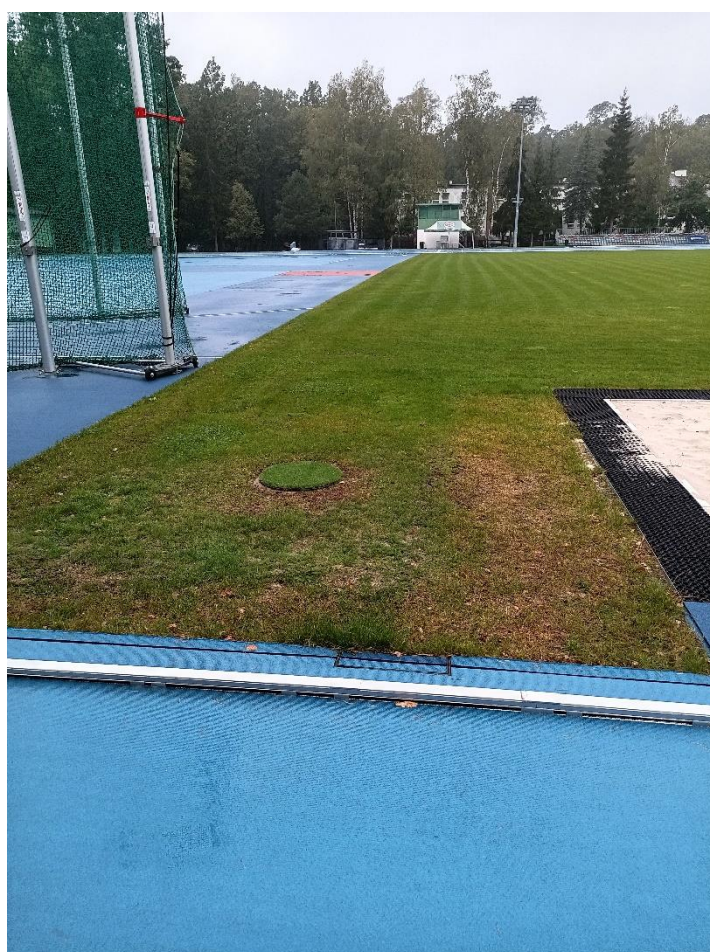
Obszar nr 4