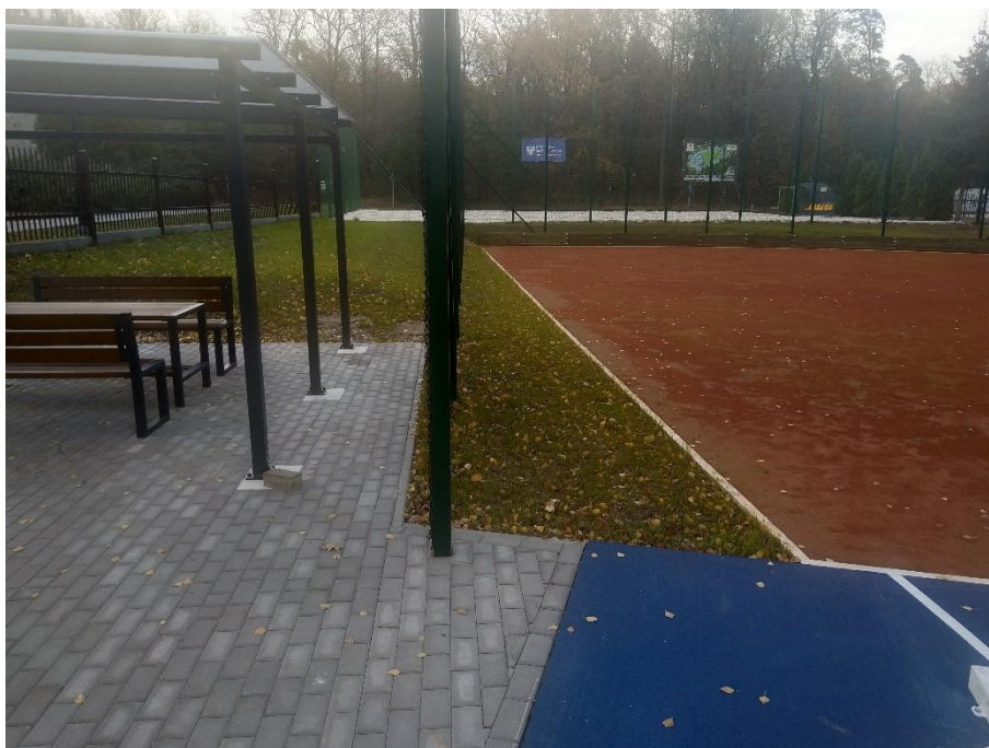
Obszar nr 5