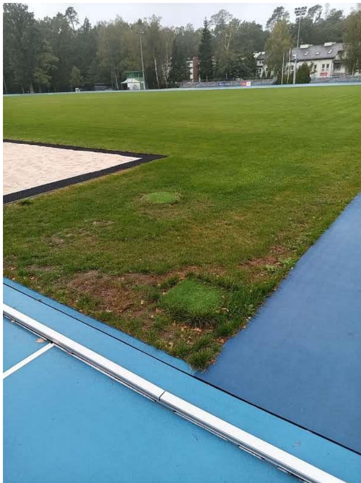
Obszar nr 1