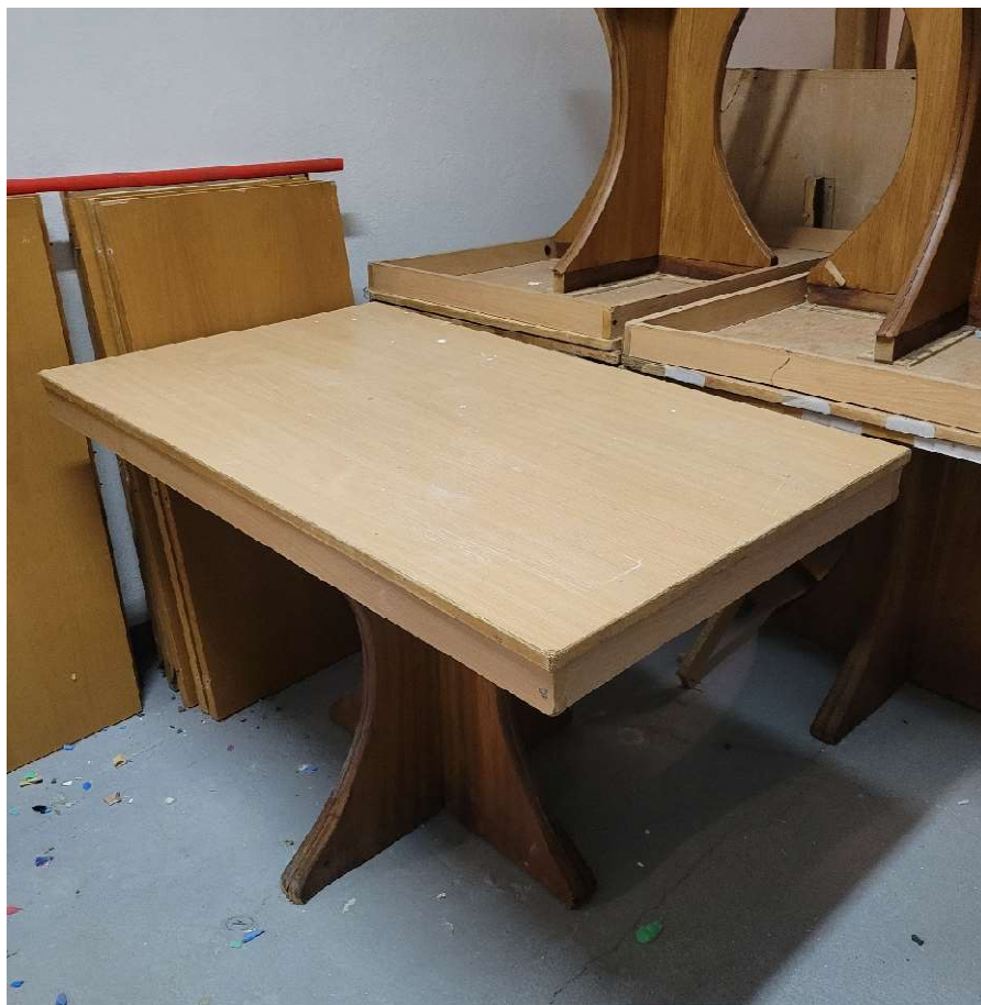
Stół o wymiarach 120 szer. x 70 dł. x 73 (prostokąt)