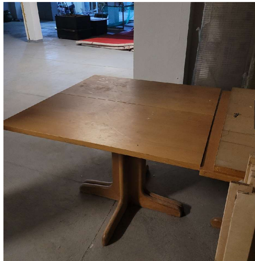
Stół o wymiarach 100 szer. x 100 dł. x 73 (kwadrat)

Stoły posiadają uszkodzenia w postaci zarysowań, zadrapań, pęknięć