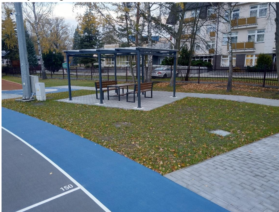
Obszar nr 1