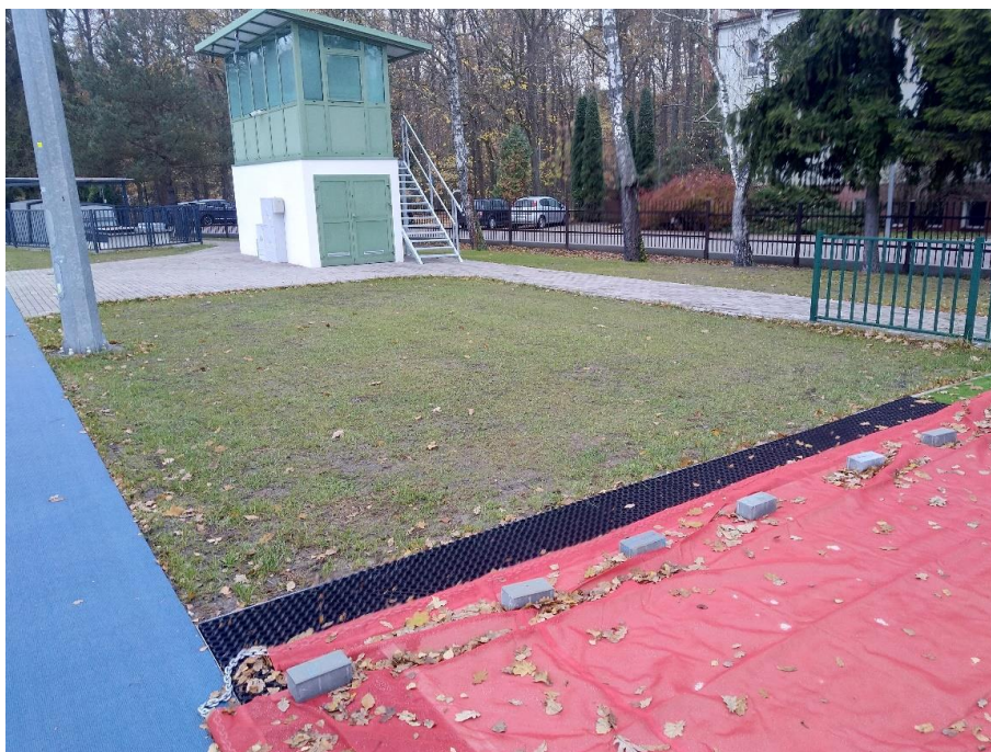
Obszar nr 3