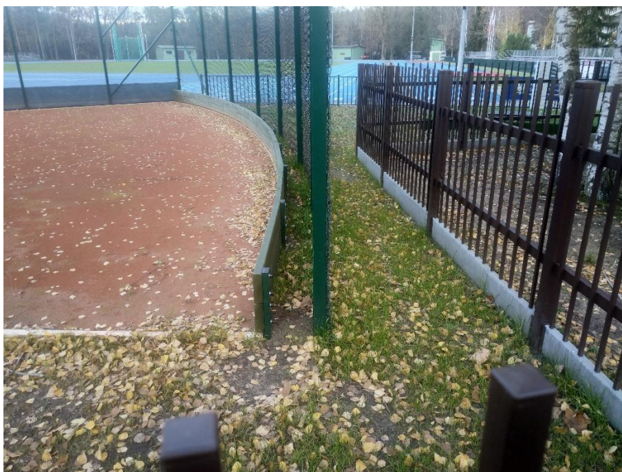
Obszar nr 6