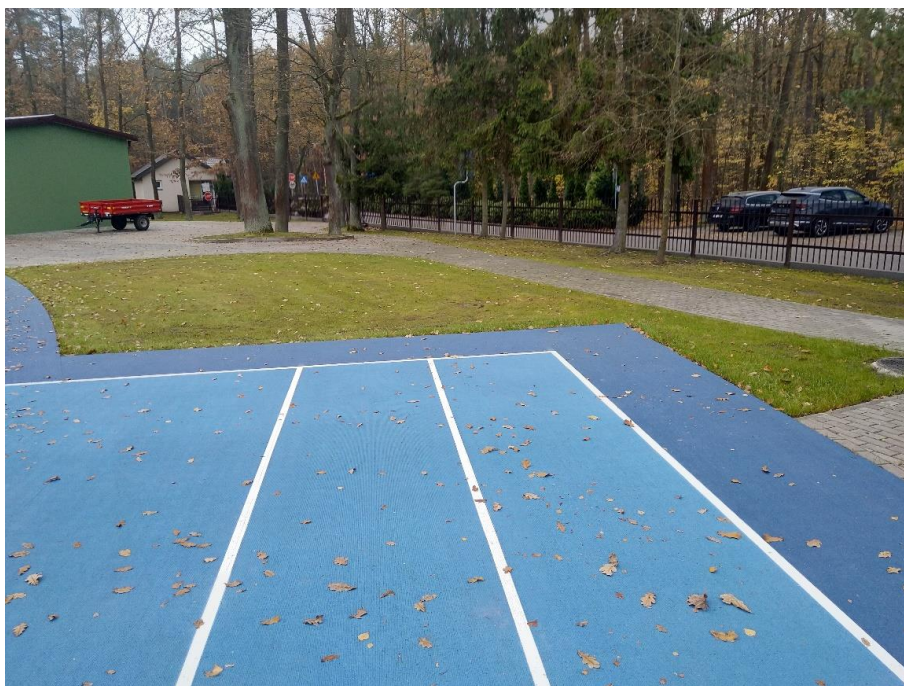
Obszar nr 5