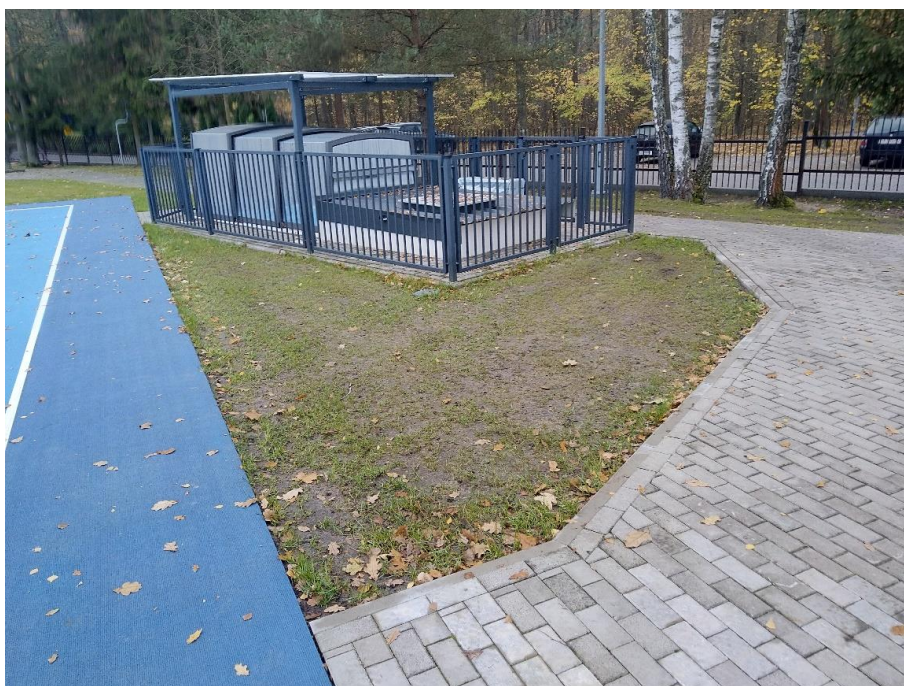
Obszar nr 4