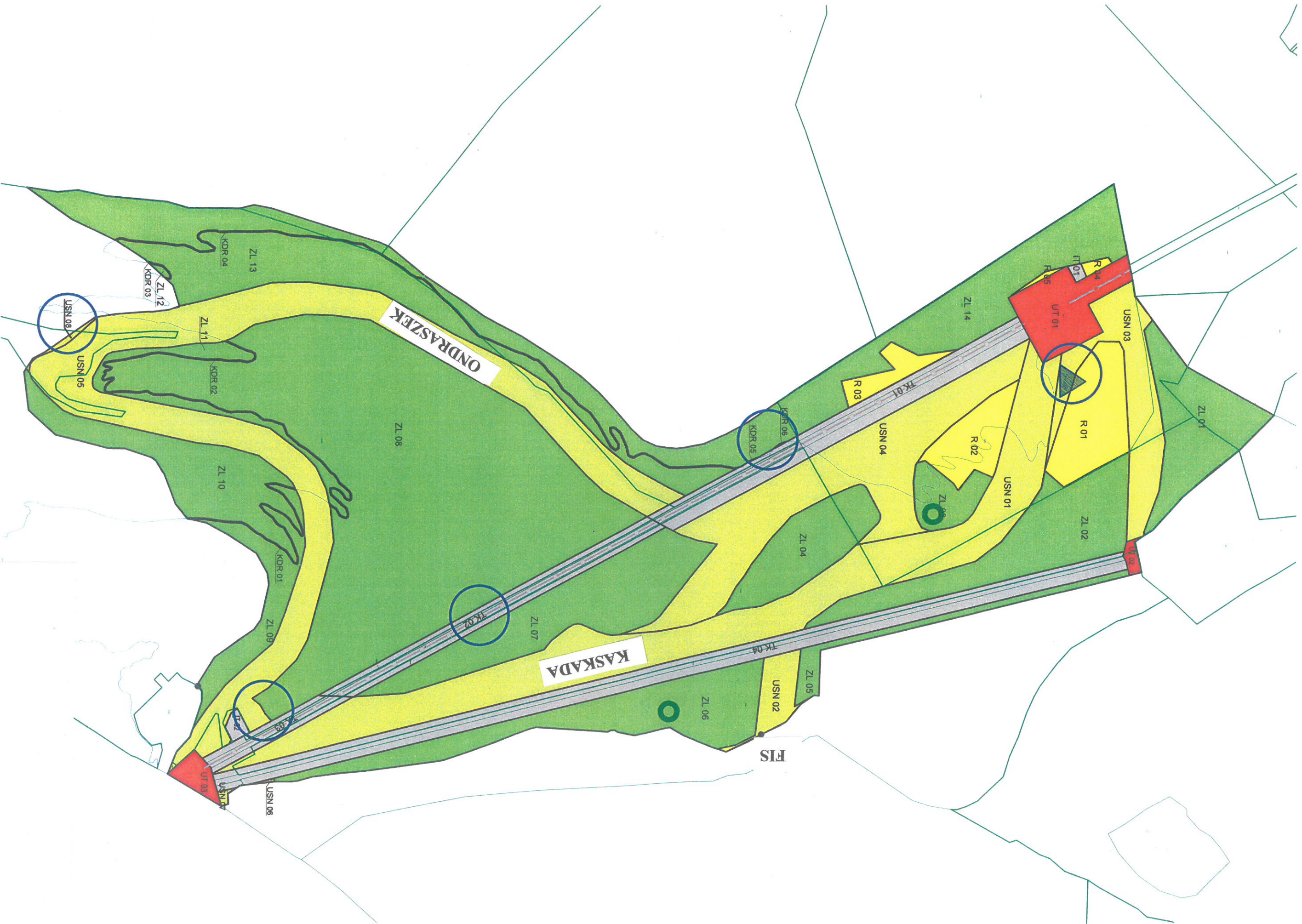
SCHEMAT TRAS NARCIARSKICH Rys. nr 1.