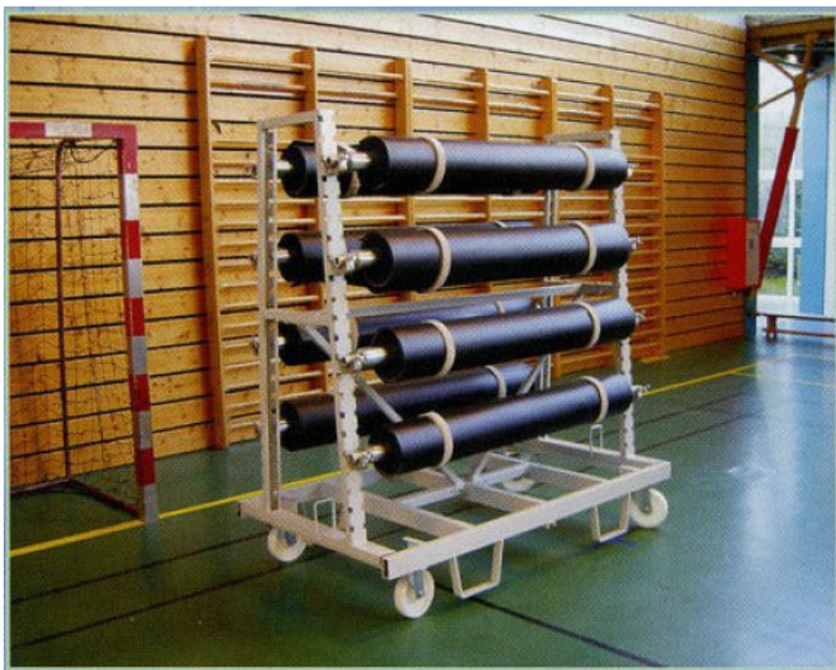
Stojaki podwójne DPP 6/8/10 rolek