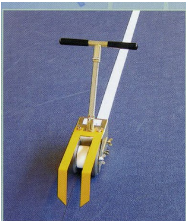
Głowica z blaszką prowadzącą do znakowania linii prostych