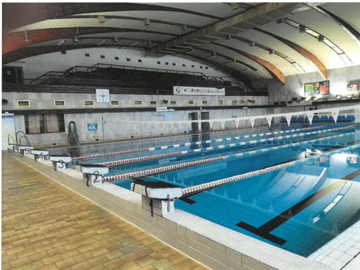
Foto: Widok ogólny niecki Pływalni COS - OPO w Spale