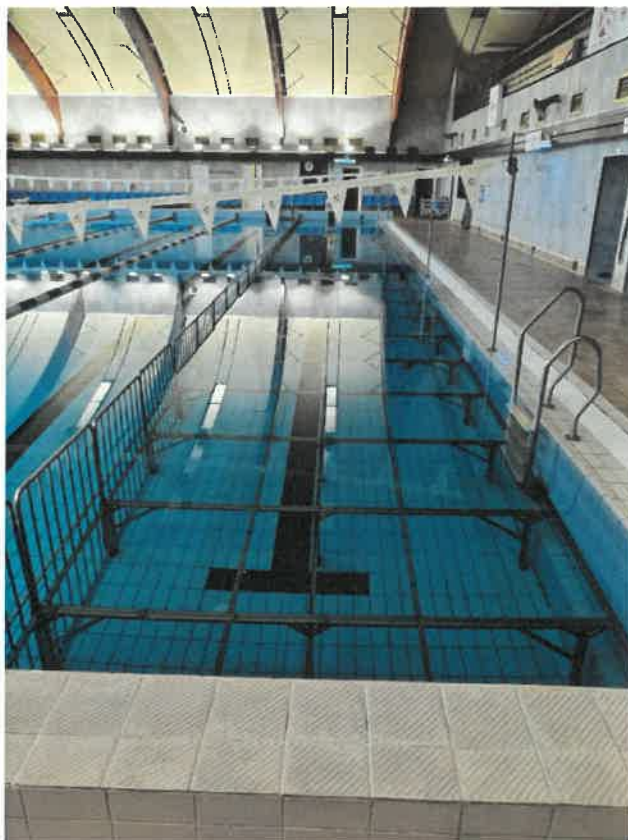
Foto: Widok pomostu wypływającego z barierką