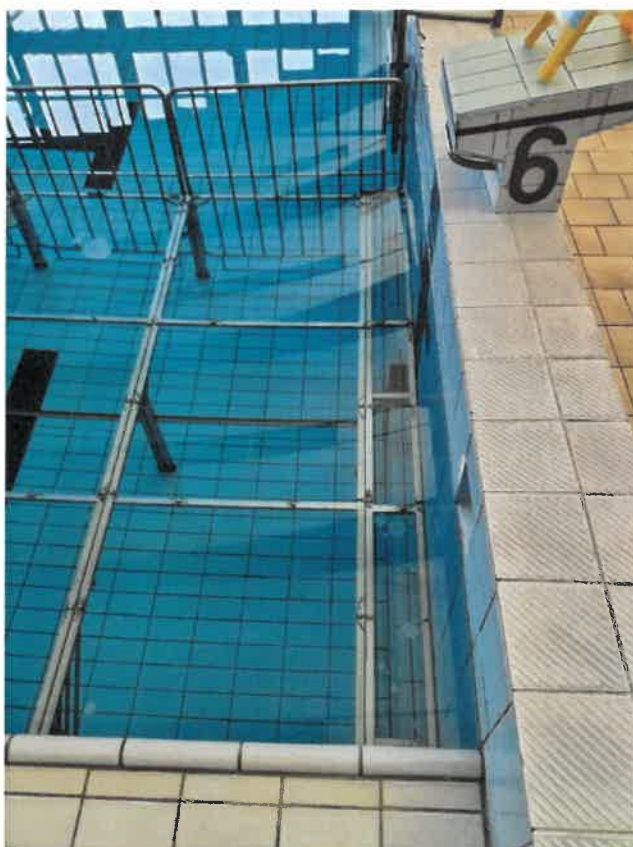
Foto: Widok pierwszego elementu pomostu od strony słupka startowego