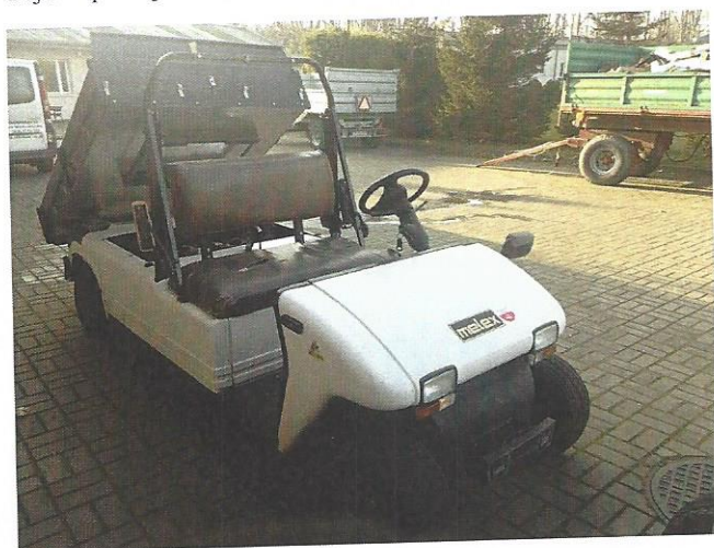
Pojtransp.z nap. el.-Melex.967.OT.Appra.01.12.20205