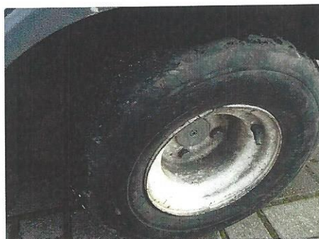
Pojtransp.z nap. el.- Melex.967.OT.Appra.01.12.20 2022