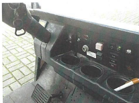
Pojtransp.z nap. el.- Melex.967.OT.Appra.01.12.20 2010