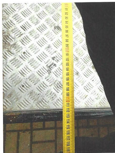
Pojtransp.z nap. el.- Melex.967.OT.Appra.01.12.20 2025