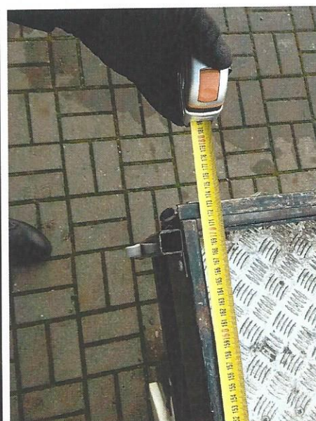
Pojtransp.z nap. el.- Melex.967.OT.Appra.01.12.20 2026