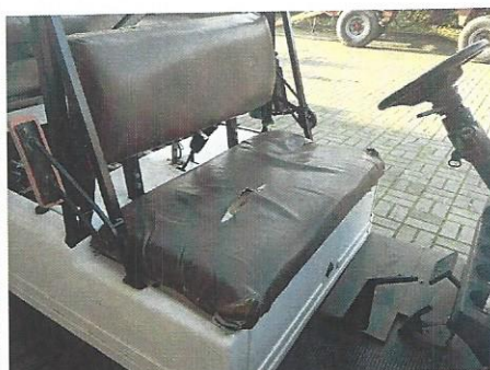
Pojtransp.z nap. el.- Melex.967.OT.Appra.01.12.20 2011