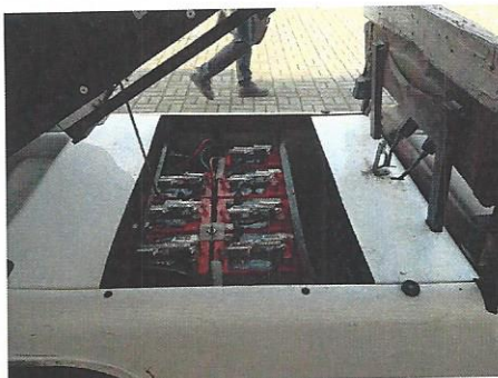
Pojtransp.z nap. el.- Melex.967.OT.Appra.01.12.20 208