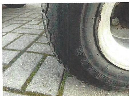
Pojtransp.z nap. el.- Melex.967.OT.Appra.01.12.20 2014