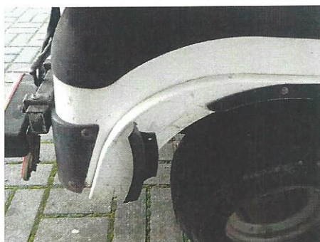
Pojtransp.z nap. el.- Melex.967.OT.Appra.01.12.20 2028