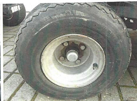
Pojtransp.z nap. el.- Melex.967.OT.Appra.01.12.20 2012