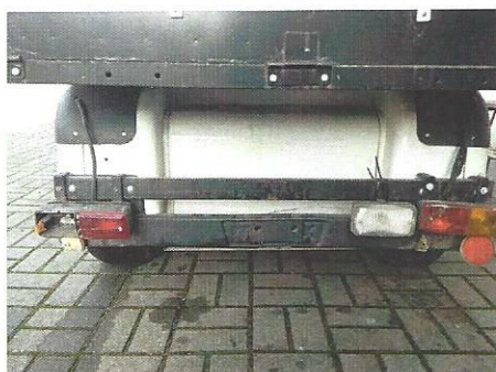
Pojtransp.z nap. el.- Melex.967.OT.Appra.01.12.20 2031