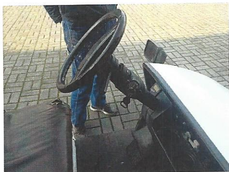
Pojtransp.z nap. el.- Melex.967.OT.Appra.01.12.20 2019