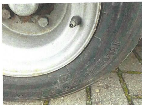
Pojtransp.z nap. el.- Melex.967.OT.Appra.01.12.20 2013