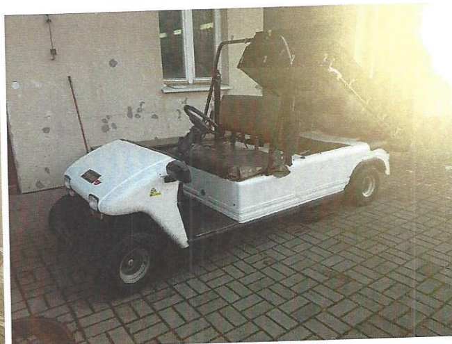
Pojtransp.z nap. el.-Melex.967.OT.Appra.01.12.20202