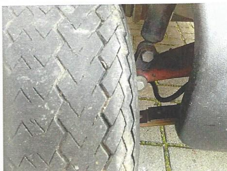
Pojtransp.z nap. el.- Melex.967.OT.Appra.01.12.20 2020