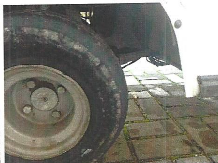
Pojtransp.z nap. el.- Melex.967.OT.Appra.01.12.20 2018