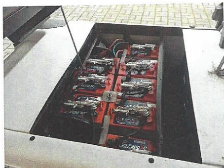
Pojtransp.z nap. el.- Melex.967.OT.Appra.01.12.20 207