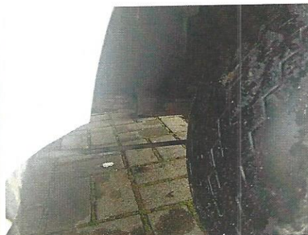
Pojtransp.z nap. el.- Melex.967.OT.Appra.01.12.20 2021