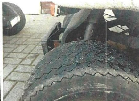
Pojtransp.z nap. el.- Melex.967.OT.Appra.01.12.20 2015