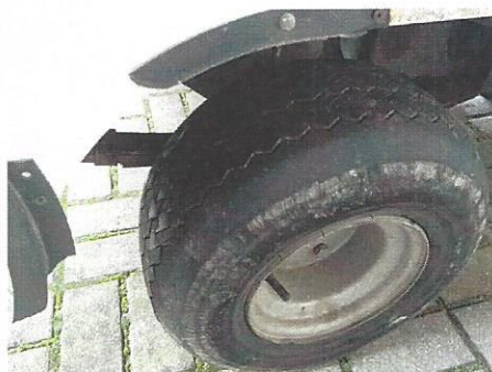
Pojtransp.z nap. el.- Melex.967.OT.Appra.01.12.20 2029