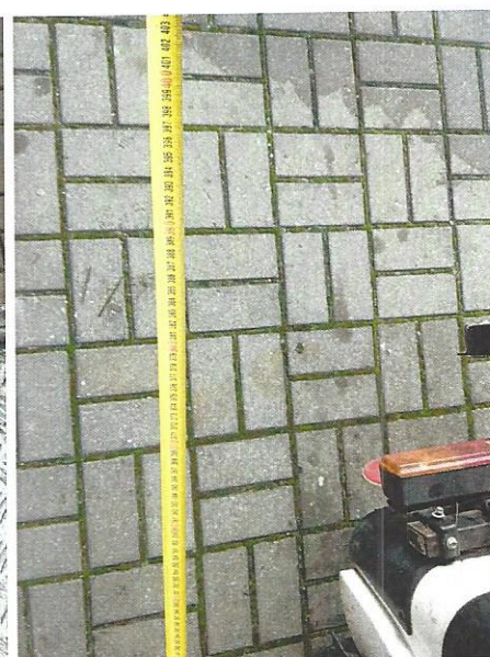
Pojtransp.z nap. el.- Melex.967.OT.Appra.01.12.20 2027