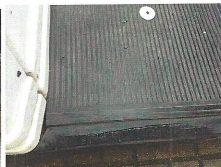
Pojtransp.z nap. el.- Melex.967.OT.Appra.01.12.20 2030