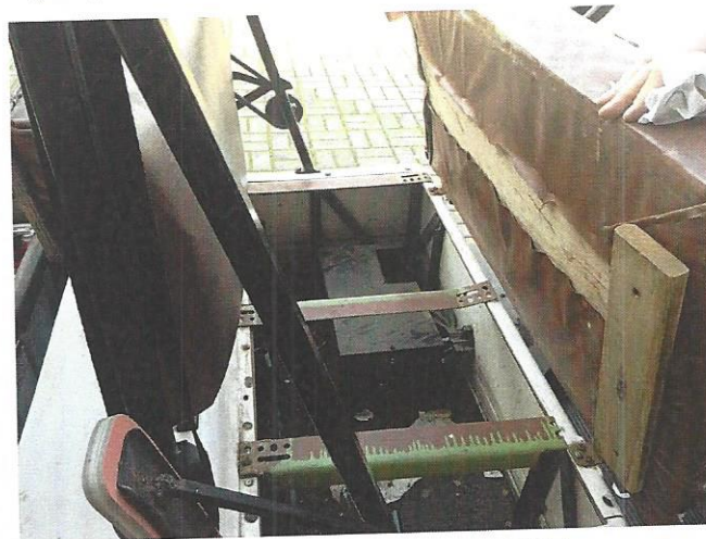
Pojtransp.z nap. el.-Melex.967.OT.Appra.01.12.20206