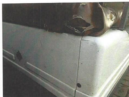
Pojtransp.z nap. el.- Melex.967.OT.Appra.01.12.20 2017