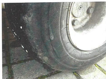
Pojtransp.z nap. el.- Melex.967.OT.Appra.01.12.20 2023