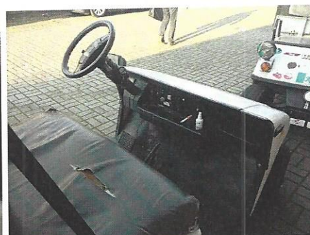
Pojtransp.z nap. el.- Melex.967.OT.Appra.01.12.20 209