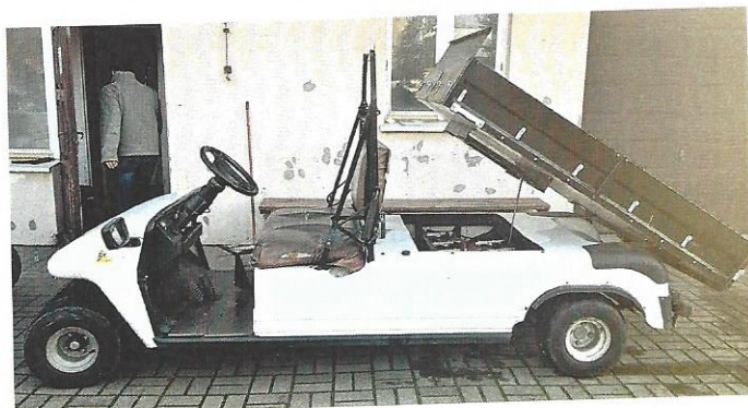
Pojtransp.z nap. el.-Melex.967.OT.Appra.01.12.20201

Rodzaj pojazdu: Pojazd transportowy-elektryczny *