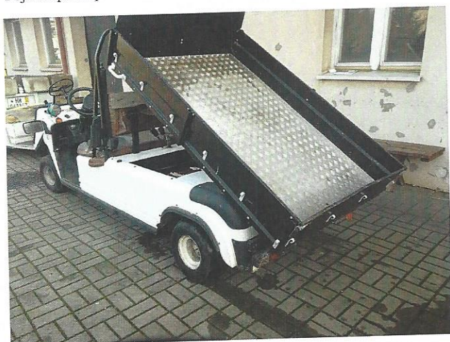
Pojtransp.z nap. el.-Melex.967.OT.Appra.01.12.20203