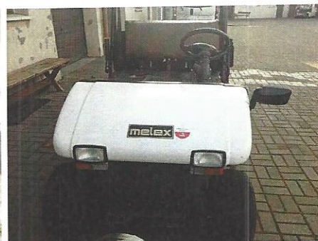
Pojtransp.z nap. el.- Melex.967.OT.Appra.01.12.20 2024