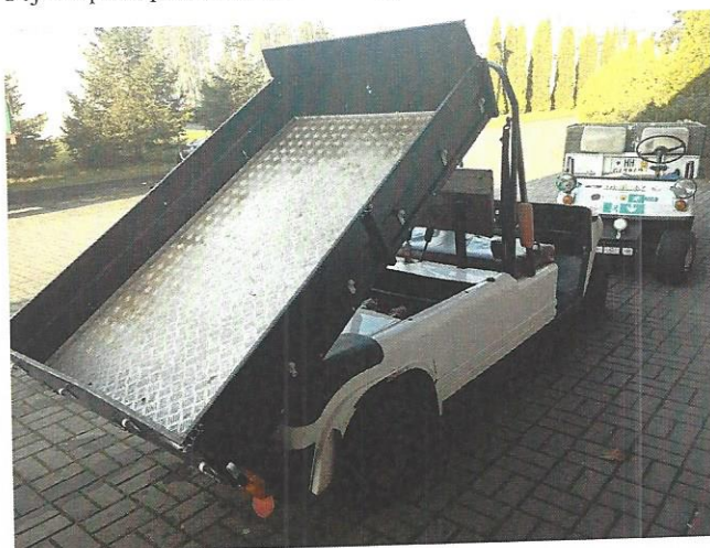
Pojtransp.z nap. el.-Melex.967.OT.Appra.01.12.20204