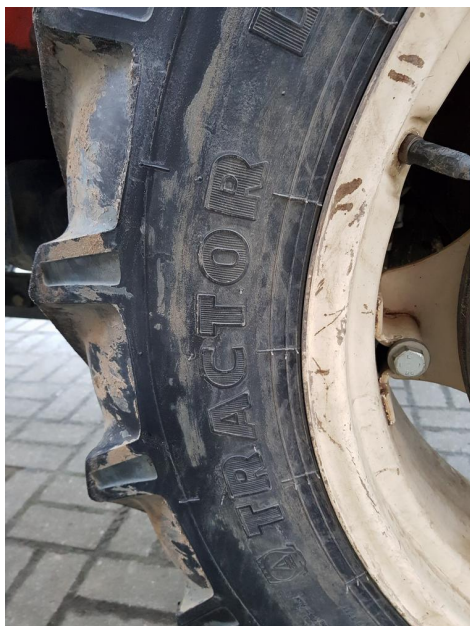
ZETOR 3320. NR IDENT.02983.ot APPRA.EU.01.12.202016