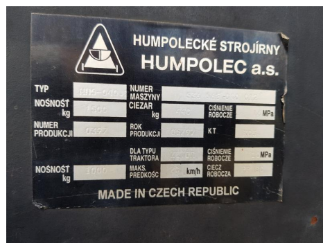
ZETOR 3320. NR IDENT.02983.ot APPRA.EU.01.12.202048