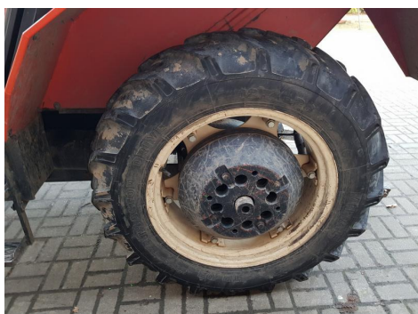
ZETOR 3320. NR IDENT.02983.ot APPRA.EU.01.12.202013