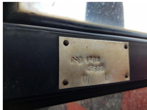
ZETOR 3320. NR IDENT.02983.ot APPRA.EU.01.12.202030