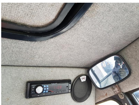
ZETOR 3320. NR IDENT.02983.ot APPRA.EU.01.12.202032