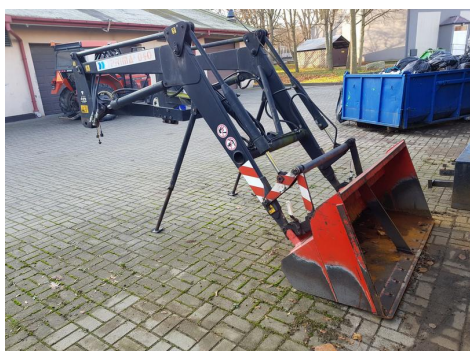
ZETOR 3320. NR IDENT.02983.ot APPRA.EU.01.12.202046