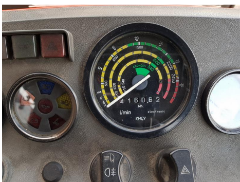
ZETOR 3320. NR IDENT.02983.ot APPRA.EU.01.12.202035