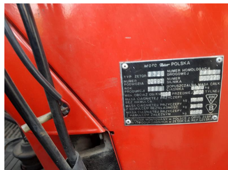
ZETOR 3320. NR IDENT.02983.ot APPRA.EU.01.12.202024