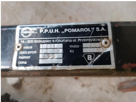
ZETOR 3320. NR IDENT.02983.ot APPRA.EU.01.12.202051