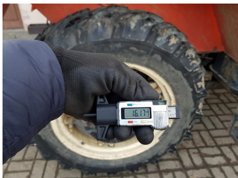
ZETOR 3320. NR IDENT.02983.ot APPRA.EU.01.12.202019