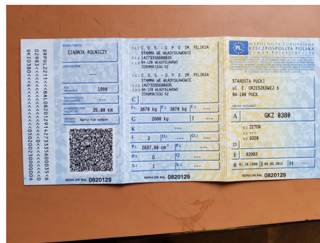
ZETOR 3320. NR IDENT.02983.ot APPRA.EU.01.12.202039