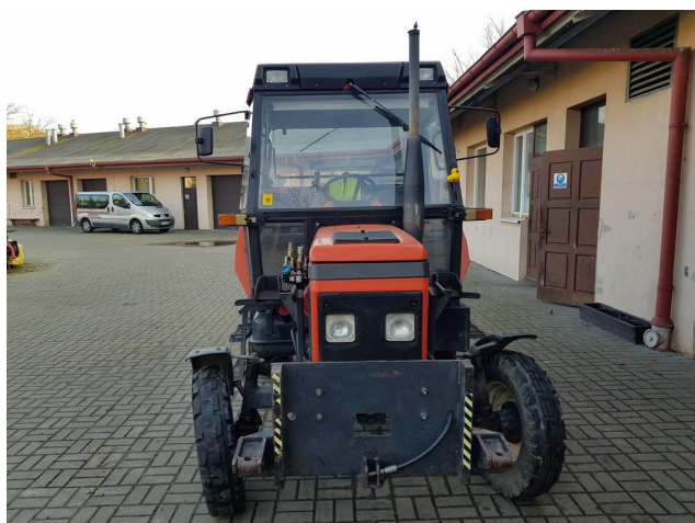
ZETOR 3320. NR IDENT.02983.ot APPRA.EU.01.12.20203