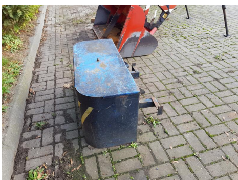
ZETOR 3320. NR IDENT.02983.ot APPRA.EU.01.12.202044