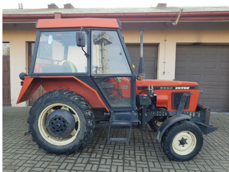
ZETOR 3320. NR IDENT.02983.ot APPRA.EU.01.12.20207