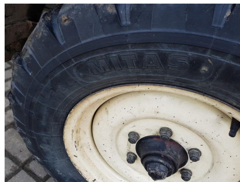
ZETOR 3320. NR IDENT.02983.ot APPRA.EU.01.12.20209