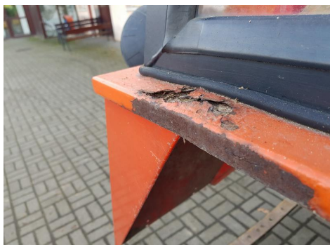
ZETOR 3320. NR IDENT.02983.ot APPRA.EU.01.12.202022