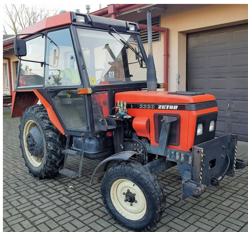
ZETOR 3320. NR IDENT.02983.ot APPRA.EU.01.12.20201