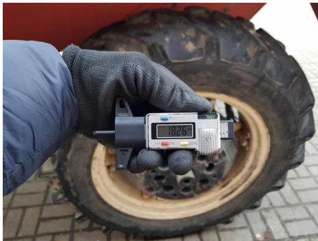
ZETOR 3320. NR IDENT.02983.ot APPRA.EU.01.12.202017