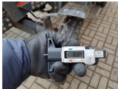
ZETOR 3320. NR IDENT.02983.ot APPRA.EU.01.12.202012