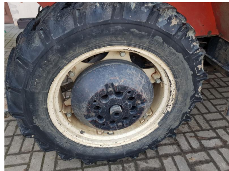
ZETOR 3320. NR IDENT.02983.ot APPRA.EU.01.12.202018