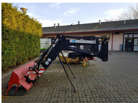
ZETOR 3320. NR IDENT.02983.ot APPRA.EU.01.12.202043