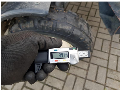
ZETOR 3320. NR IDENT.02983.ot APPRA.EU.01.12.202011