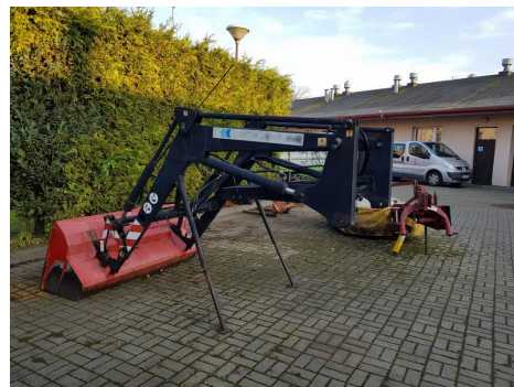
ZETOR 3320. NR IDENT.02983.ot APPRA.EU.01.12.202042