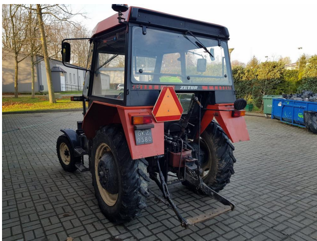
ZETOR 3320. NR IDENT.02983.ot APPRA.EU.01.12.20206