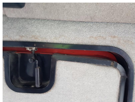
ZETOR 3320. NR IDENT.02983.ot APPRA.EU.01.12.202036