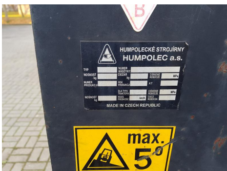
ZETOR 3320. NR IDENT.02983.ot APPRA.EU.01.12.202047