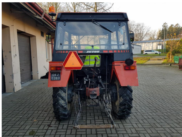
ZETOR 3320. NR IDENT.02983.ot APPRA.EU.01.12.20205