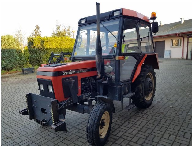
ZETOR 3320. NR IDENT.02983.ot APPRA.EU.01.12.20202