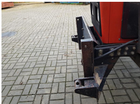
ZETOR 3320. NR IDENT.02983.ot APPRA.EU.01.12.202028