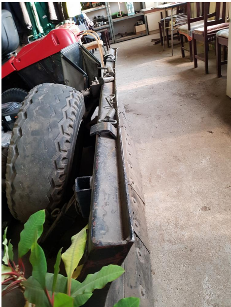
ZETOR 3320. NR IDENT.02983.ot APPRA.EU.01.12.202050