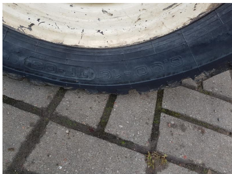
ZETOR 3320. NR IDENT.02983.ot APPRA.EU.01.12.202010