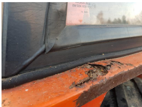
ZETOR 3320. NR IDENT.02983.ot APPRA.EU.01.12.202025