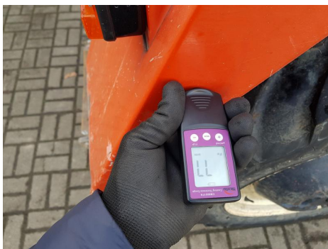
ZETOR 3320. NR IDENT.02983.ot APPRA.EU.01.12.202020