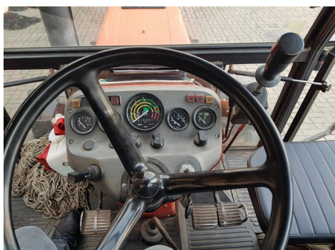
ZETOR 3320. NR IDENT.02983.ot APPRA.EU.01.12.202031