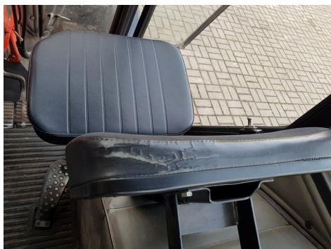
ZETOR 3320. NR IDENT.02983.ot APPRA.EU.01.12.202037