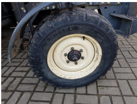
ZETOR 3320. NR IDENT.02983.ot APPRA.EU.01.12.20208