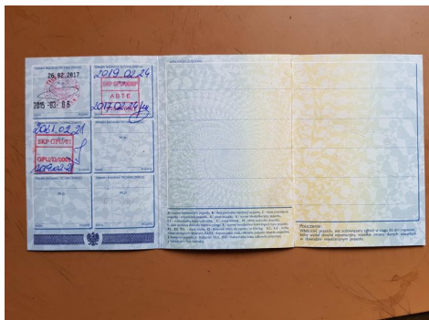
ZETOR 3320. NR IDENT.02983.ot APPRA.EU.01.12.202040