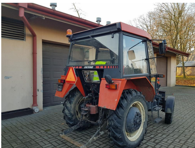
ZETOR 3320. NR IDENT.02983.ot APPRA.EU.01.12.20204