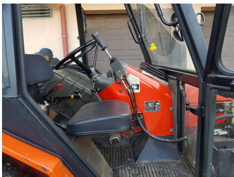
ZETOR 3320. NR IDENT.02983.ot APPRA.EU.01.12.202023