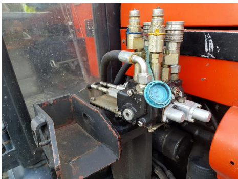
ZETOR 3320. NR IDENT.02983.ot APPRA.EU.01.12.202041