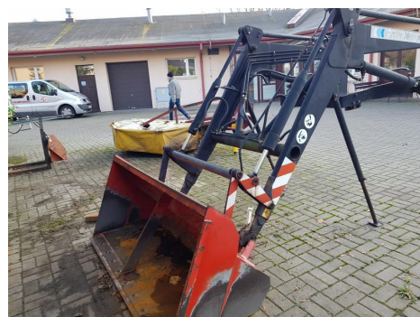
ZETOR 3320. NR IDENT.02983.ot APPRA.EU.01.12.202045