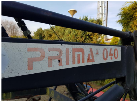
ZETOR 3320. NR IDENT.02983.ot APPRA.EU.01.12.202049