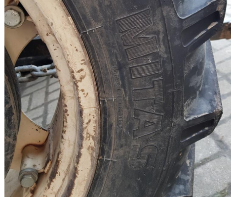
ZETOR 3320. NR IDENT.02983.ot APPRA.EU.01.12.202015