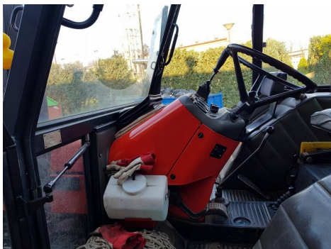
ZETOR 3320. NR IDENT.02983.ot APPRA.EU.01.12.202029