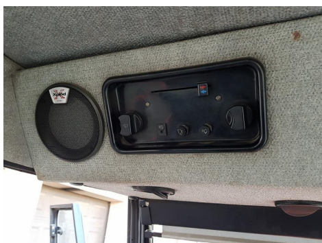
ZETOR 3320. NR IDENT.02983.ot APPRA.EU.01.12.202034