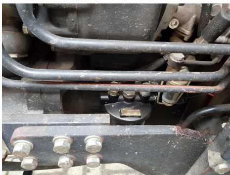
ZETOR 3320. NR IDENT.02983.ot APPRA.EU.01.12.202038