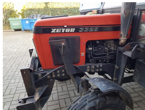
ZETOR 3320. NR IDENT.02983.ot APPRA.EU.01.12.202027