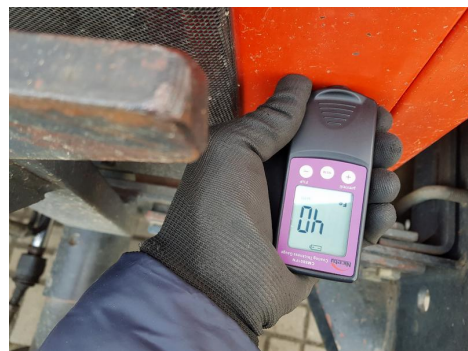
ZETOR 3320. NR IDENT.02983.ot APPRA.EU.01.12.202021