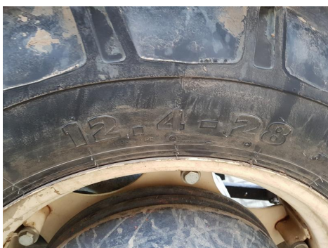
ZETOR 3320. NR IDENT.02983.ot APPRA.EU.01.12.202014