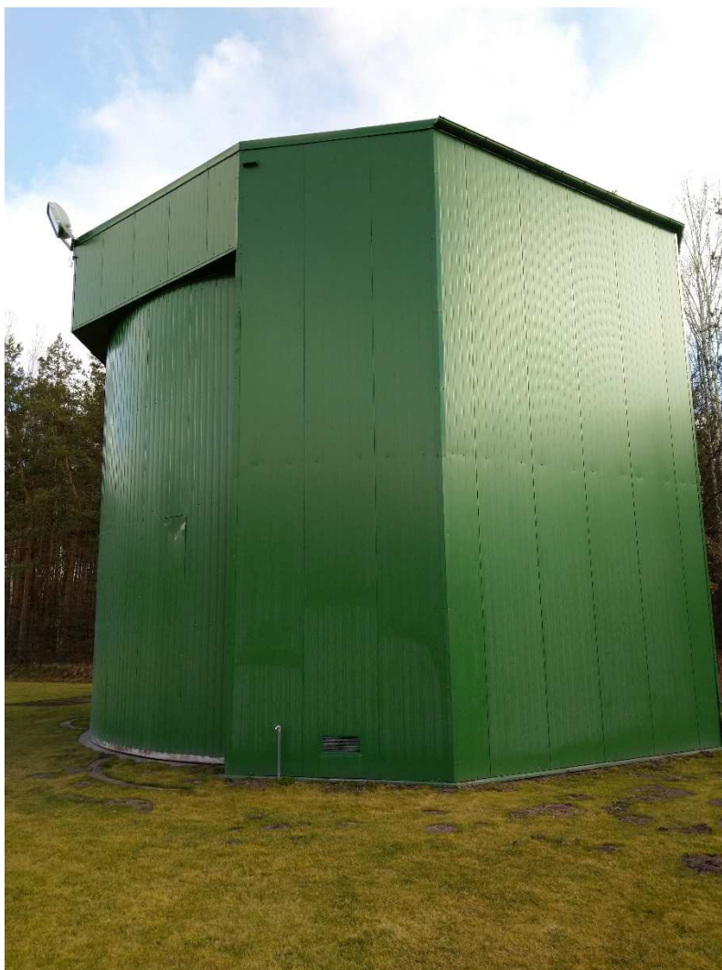
Widok ogólny hangaru