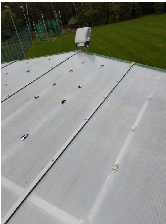
Widok dachu w kierunku rzutni