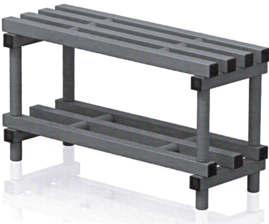
2. ławka dł. 1500mm