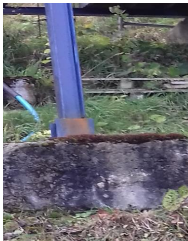
Fot.3 fundamenty porośnięte mchem