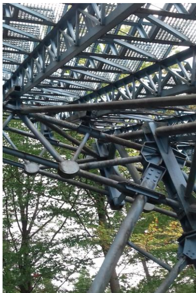
Fot.3 początkowa korozja elementów stalowych