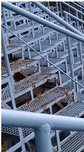
Fot.2 korozja stopni z krat HMS